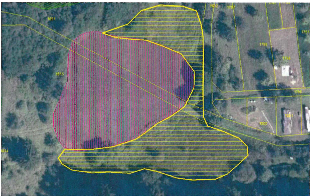
Rot schraffiert: kartierte Magere Flachland-Mähwiese, gelb schraffiert: Fläche für Kompensationsmaßnahmen

Diese Hangflächen sind durch geeignete Maßnahmen (Entbuschung, regelmäßiges Mähen, Entfernen des Mähgutes) zu einer Flachlandmähwiese zu entwickeln und dauerhaft als solche zu pflegen.