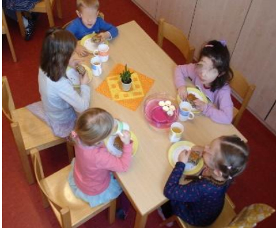
Vor dem Essen beten wir