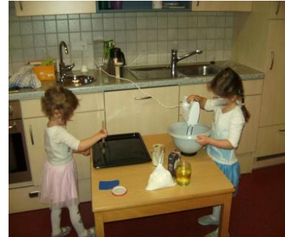
Es wird auch fleißig gebacken und gekocht.