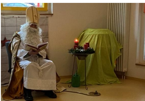
Besuch des Bischof Nikolaus im Kindergarten

Jedes Jahr an St. Martin ziehen wir mit den Laternen durch die Straßen