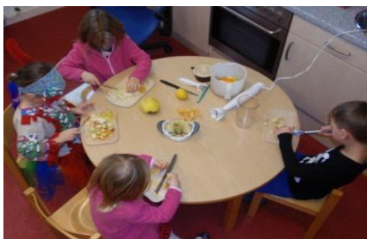
Hier werden leckere Getränke gemacht.

Im täglichen Umgang und bei Aktivitäten findet religiöse Erziehung statt.