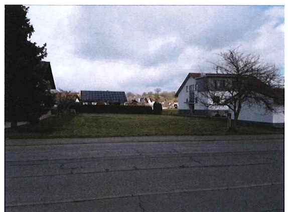
Blick nach Nordosten von der Täbinger Straße über das Flurstück 46/2