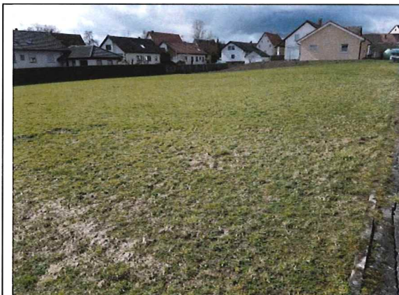
Blick nach Südwesten von der Lilienstraße über die Flurstücke 48/4 und 49/1

Nachfolgende Fotos geben einen Eindruck des Plangebiets wieder.