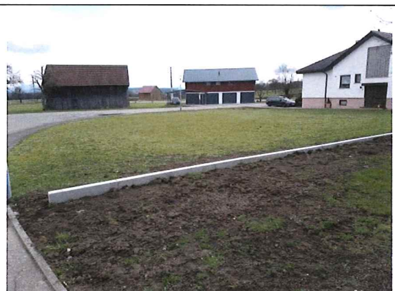
Blick nach Südosten von der Lilienstraße über das Flurstück 47/3