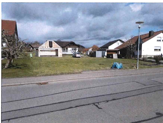
Blick nach Nordosten von der Täbinger Straße über das Flurstück 46/4